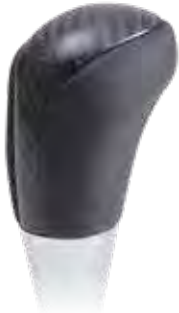
ブラックカーボン 品番:AS-SK-M8-BKC ¥13,200(税込)