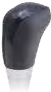
ブラックウッド 品番:AS-SK-M8-BKW ¥9,900(税込)