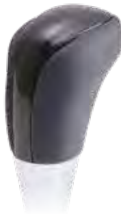
ブラックウッド2 品番:AS-SK-M8-BKW2 ¥9,900(税込)