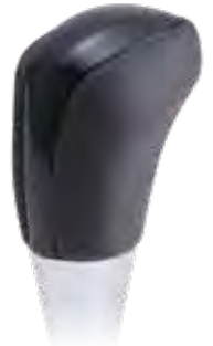
コスミックブラック 品番:AS-SK-M8-PBK ¥9,900(税込)