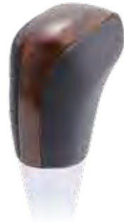
ブラウンウッド 品番:AS-SK-M8-BRW ¥9,900(税込)